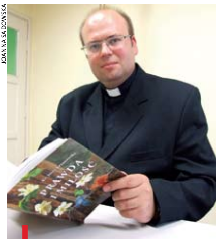
Ks. Jerzy Krzanowski w swej książce ukazuje bogactwo i aktualność filozofii bp. Stepy

W literaturze filozoficznej brakowało całościowego opracowania myśli filozoficznej bp. Jana Stepy. Publikacja „Prawda i miłość” tę lukę wypełnia.