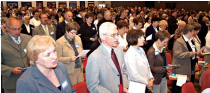
Forum rozpoczęło hymnem do Ducha Świętego

W przededniu parlamentarnej debaty na temat in vitro w Tarnowie dyskutowano o świętości i wartości życia każdego człowieka.